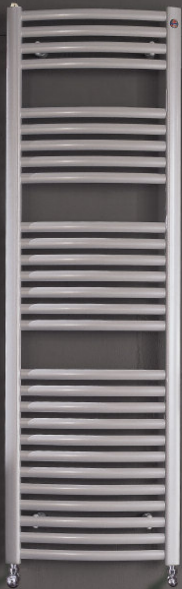
Radiatore verniciato colore Grigio Alluminio RAL 9006 (cod. B4)