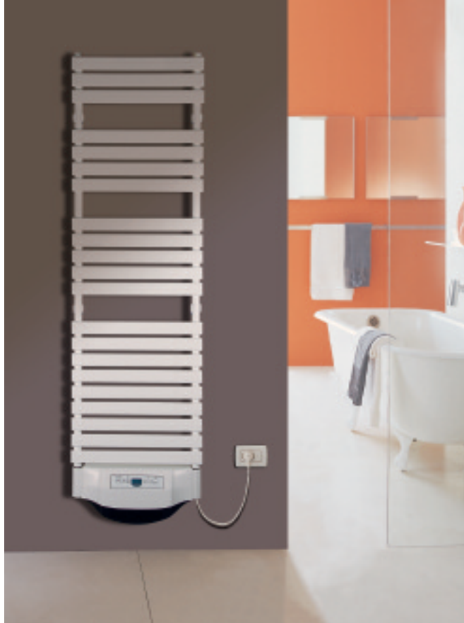
In foto: Radiatore Xilo Aliseo Elettrico. Altezza mm 1584, larghezza mm 506, colore Bianco Standard (cod. 01) - resistenza elettrica.