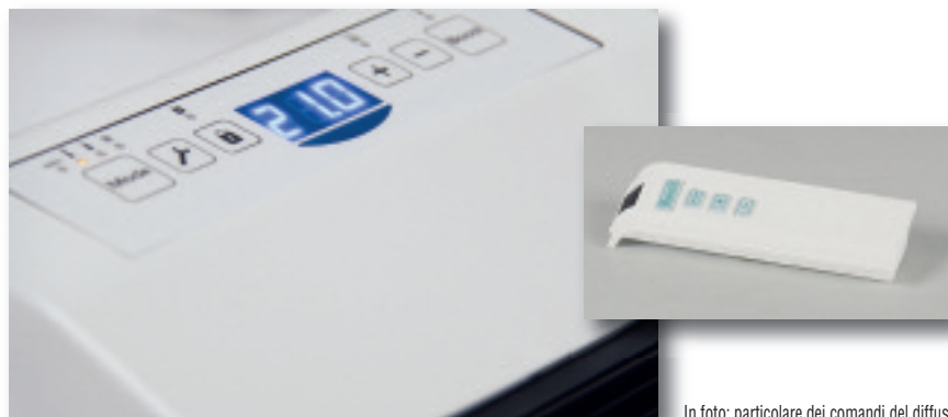
In foto: particolare dei comandi del diffusore d'aria e del controllo remoto.

L'imballo comprende: 4 infratubo per fissaggio a muro; 1 telecomando per controllo remoto.