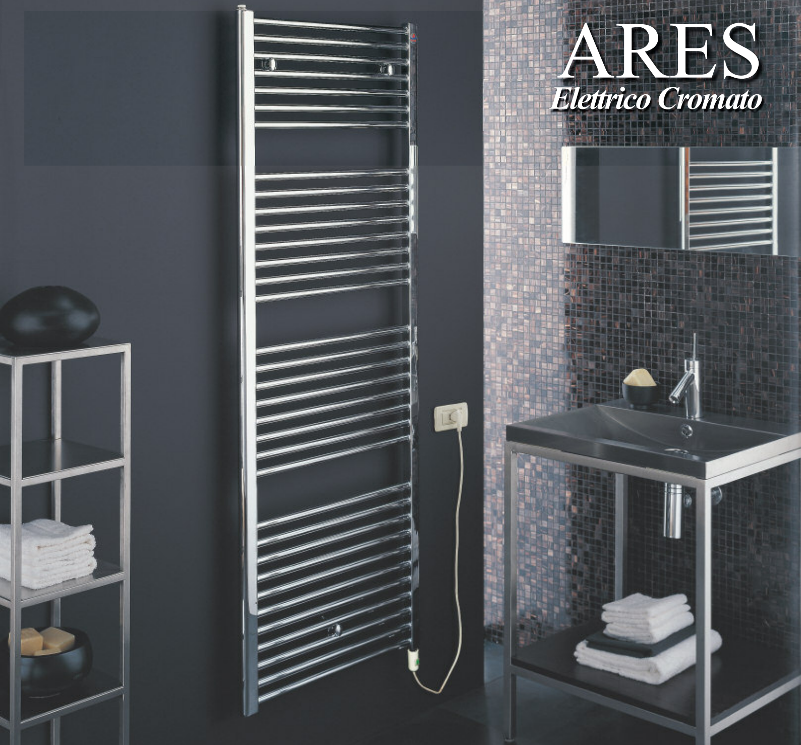
Radiatore Cromato (cod. 50). Resistenza con interruttore.