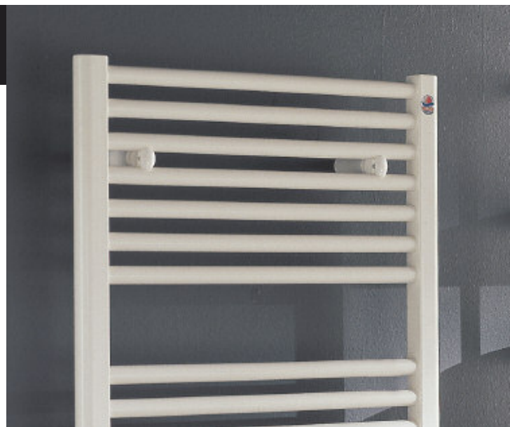
Ares Elettrico Cromato è disponibile anche colore Bianco Standard (cod. 01)

Alimentazione 230 V / 1 ph / 50 Hz, classe 1, IP 54.