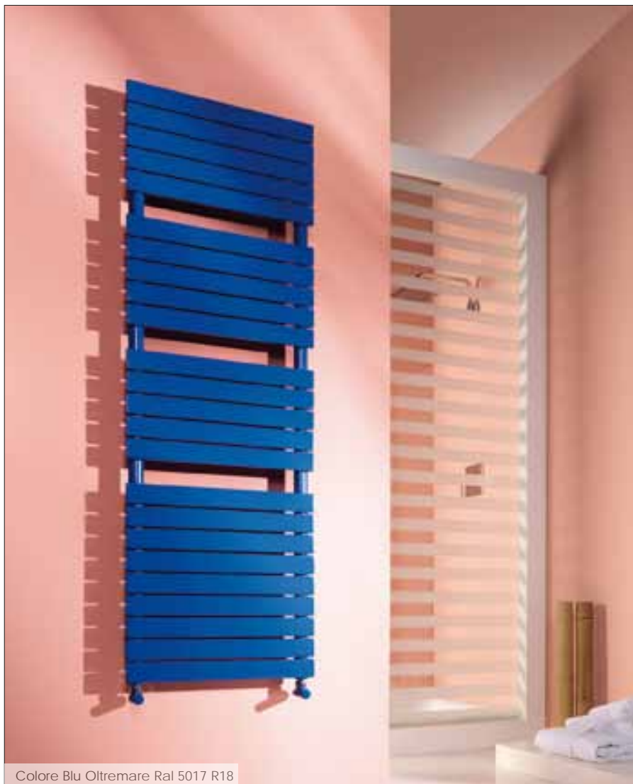
Colore Blu Oltremare Ral 5017 R18

Dory è il radiatore d'arredo Cordivari realizzato con radiante piatto: un perfetto mix fra classe, eleganza e linearità. La sapiente armonia fra collettori tondi e radianti piatti è il punto di forza di questo corpo scaldante, che trova la sua collocazione ideale negli ambienti bagno. La qualità di realizzazione, la pulizia delle saldature e la sua brillante verniciatura garantiscono un'elevata resa termica e conferiscono a Dory eleganza e raffinatezza.