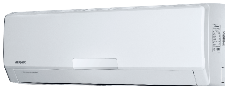
SE250W - SE351W - SE500W - SE700W