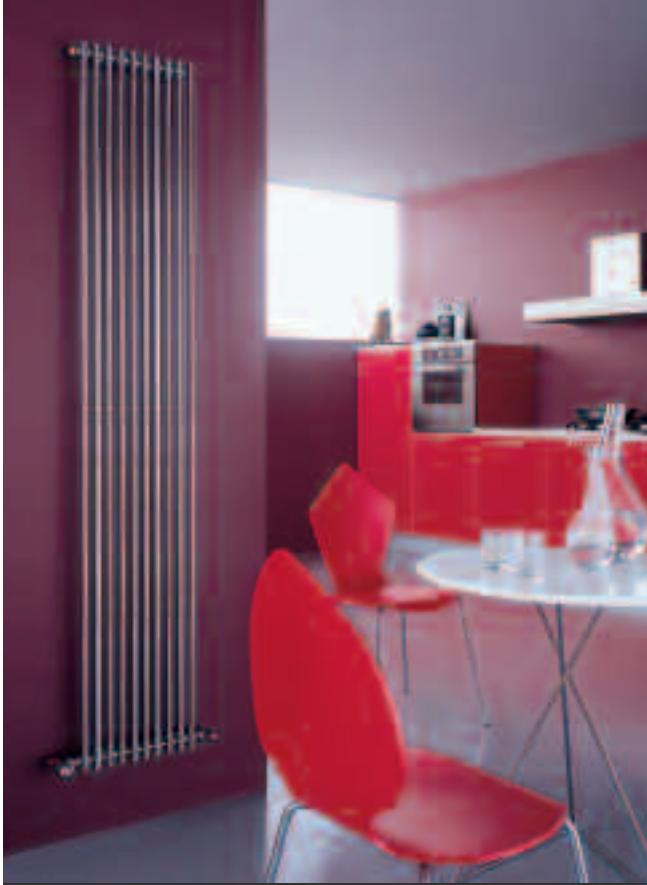
In foto: Radiatore Arpa Cromato. Altezza mm 2020, 10 elementi, colore Cromato (cod. 50).