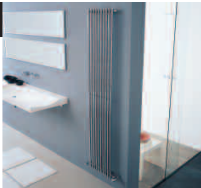
Radiatore Arpa cromato (cod. 50)

ARPA CROMATO rinnova l'immagine del radiatore: essenza delle forme, linee slanciate e leggere ARPA CROMATO trasforma lo spazio evidenziando un design equilibrato e raffinato. Disponibile in altezze da 520 a 920 mm con lunghezze da 4 a 40 elementi in numero pari ed in altezze da 1520 a 2520 mm con lunghezze da 4 a 28 elementi sempre in numero pari.