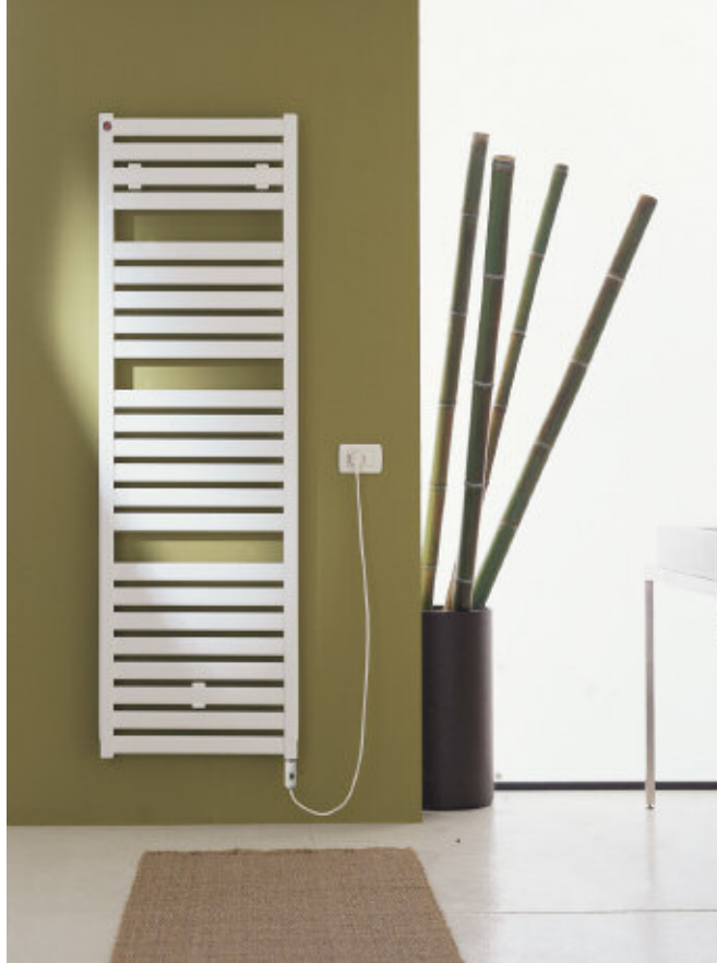
In foto: Radiatore Vela Elettrico. Altezza mm 1820, larghezza mm 560, colore Bianco Edelweiss Opaco (cod. 34) - resistenza con interruttore.